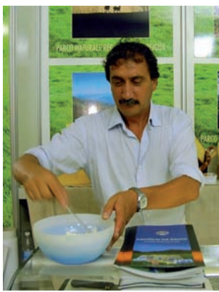
PRODUZIONE dello yogurt

● I prodotti liguri fanno furore. Il Sambuchino della Valle Scrivia e lo yogurt artigianale della cooperativa casearia di Santo Stefano D'Aveto hanno