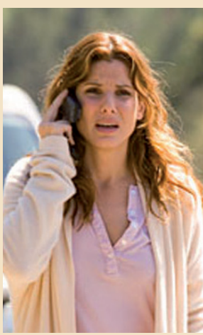
L'ATTTRICE Sandra Bullock